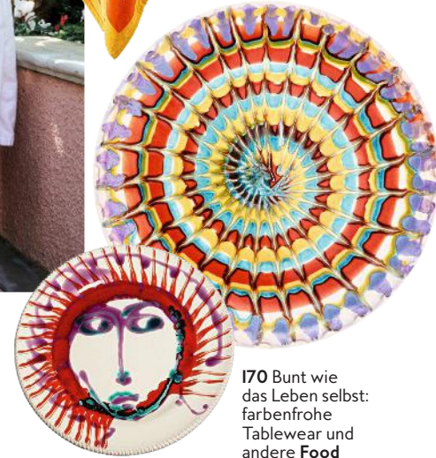
170 Bunt wie das Leben selbst: farbenfrohe Tableware und andere Food News