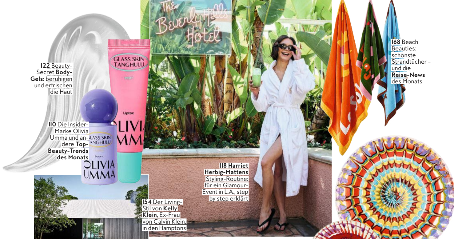
122 Beauty-Secret Body-Gels: beruhigen und erfrischen die Haut