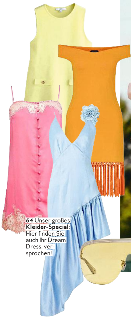
64 Unser großes Kleider-Special: Hier finden Sie auch Ihr Dream Dress, versprochen!