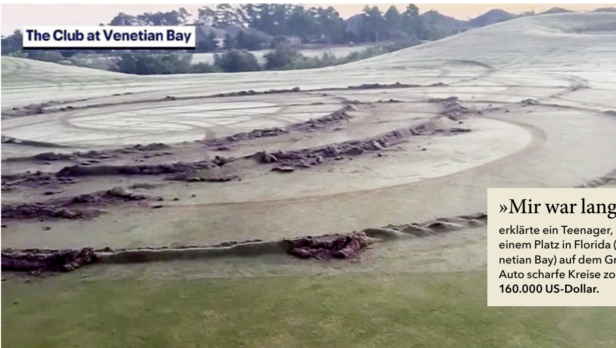
The Club at Venetian Bay