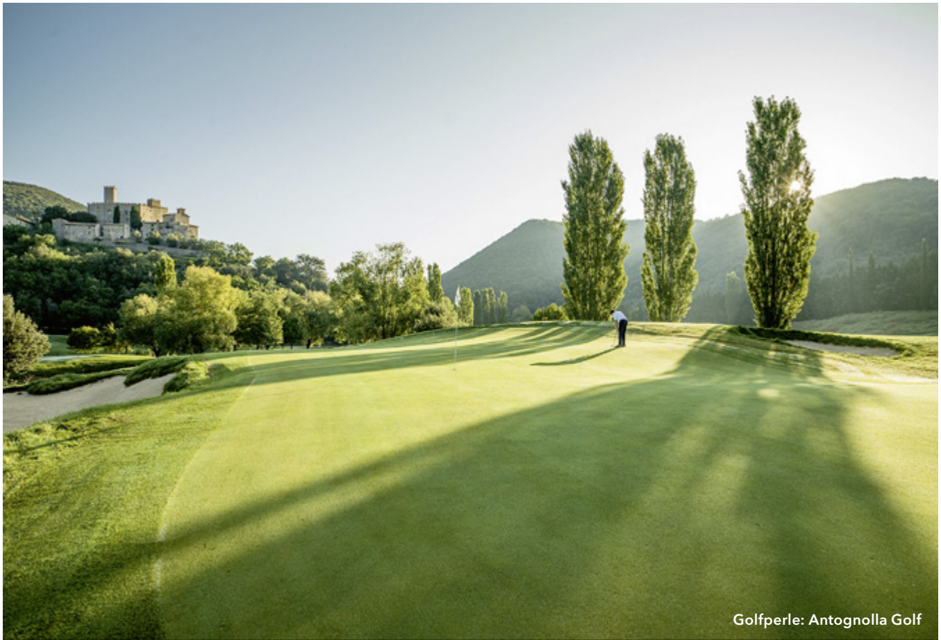
Golfperle: Antognolla Golf