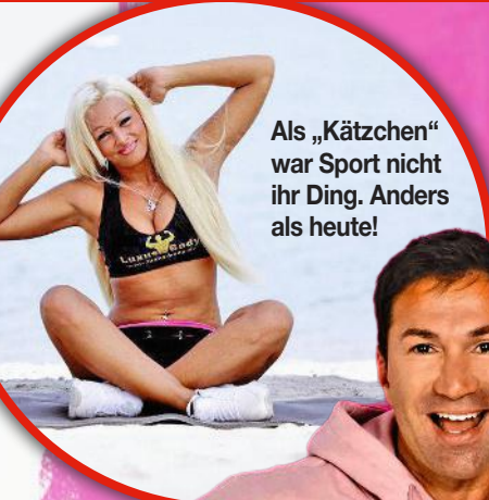
Als „Kätzchen“ war Sport nicht ihr Ding. Anders als heute!

Trotz Abnehm-Erfolg: Der TV-Star ist noch immer nicht happy mit ihrem Body!