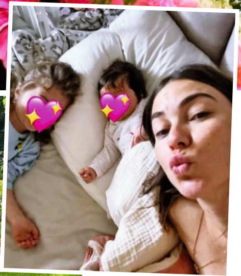
Mit den Mäusen im Bett schmusen ist der schönste Zeitvertreib