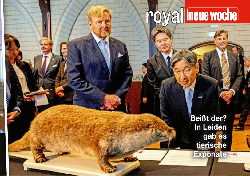
Beißt der? In Leiden gab es tierische Exponate

Ihre Laune steckt an! Königin Máxima der Niederlande