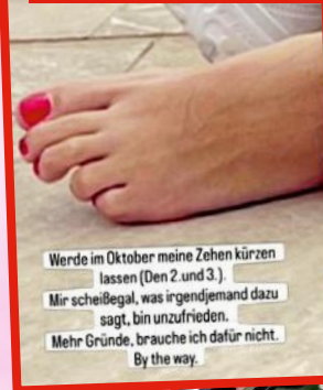
Werde im Oktober meine Zehen kürzen lassen (Den 2 und 3.) Mir scheißegal, was irgendetwas dazu sagt, bin unzufrieden. Mehr Gründe, brauche ich dafür nicht. By the way.