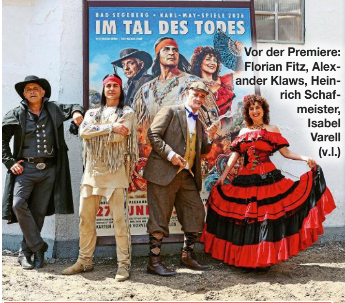
Vor der Premiere: Florian Fitz, Alexander Klaws, Heinrich Schafmeister, Isabel Varell (v.l.)