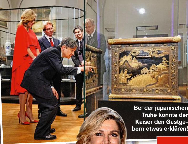
Bei der japanischen Truhe konnte der Kaiser den Gastgebern etwas erklären!