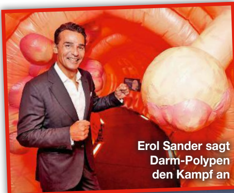
Erol Sander sagt Darm-Polypen den Kampf an

TV-Star Hans Sigl (56) konnte da nur zustimmen und nahm sich die Herren zur Brust: „Wir Männer glauben immer noch, die Unverwundbarkeit hält, bis wir 100 sind. Dem ist aber nicht so.“ Er appellierte: „Gehen Sie zur Vorsorge!“