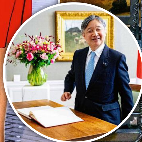
Der Kaiser aus dem Land des Lächelns trägt sich ins Gästebuch ein