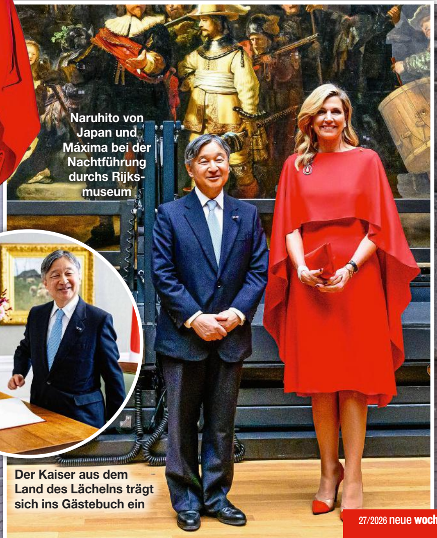
Naruhito von Japan und Máxima bei der Nachtführung durchs Rijksmuseum

Edle Bankette, steife Protokoll-Termine? Nicht bei den Holländern. Natürlich wurde der offizielle Besuch von Kaiser Naruhito (66) und Kaiserin Masako von Japan (62) mit royaler Etikette gewürdigt. Doch König Willem-Alexander (59) und Königin Máxima der Niederlande (55) sorgten für eine kleine Sensation: Das sonst sehr zurückhaltend auftretende Kaiserpaar posierte auch mal mit Fußballschals und war bei der Führung durch das Rijksmuseum in Amsterdam mit Neugierde und sichtlicher Begeisterung für alte Meister & Co. dabei. „Máxima“! gelungenes Programm!