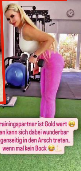
Ein Trainingspartner ist Gold wert 😊 Man kann sich dabei wunderbar gegenseitig in den Arsch treten, wenn mal kein Bock 😂👉

O. l.: Der 2. & 3. Zeh sollen kürzer werden. M.: Im Fitness-Studio ist sie am liebsten. O. r.: Haarausfall durch Extensions! R.: Schon früh fing der Beauty-Wahn an