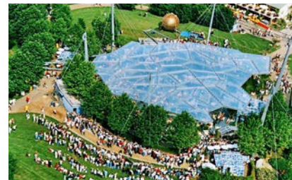
Das Gelände auf dem Mainzer Lerchenberg umfasst 90 000 m²