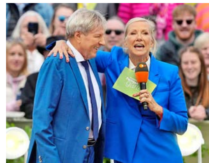
Kiwis Kumpel: Bis August 2025 war Bernhard Brink 41 Mal zu Gast