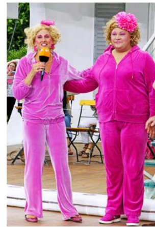
2011 schlüpfte Andrea Kiewel in das gleiche Outfit wie ihr Gast Cindy aus Marzahn (r.)