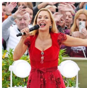
Stefanie Hertel ist mit More Than Words am 26.7. zu Gast