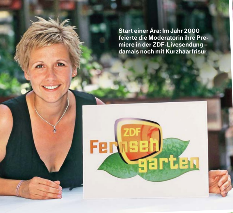
Start einer Ära: Im Jahr 2000 feierte die Moderatorin ihre Premiere in der ZDF-Livesendung – damals noch mit Kurzhaarfrisur