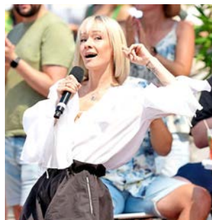
Christin Stark gratuliert Kiwi am 5. Juli zum Jubiläum

von TV-Moderatorin Andrea Kiewel. Sie schreibt jede Woche exklusiv in Super Illu