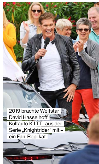
2019 brachte Weltstar David Hasselhoff Kultauto K.I.T.T. aus der Serie „Knight Rider“ mit – ein Fan-Replikat