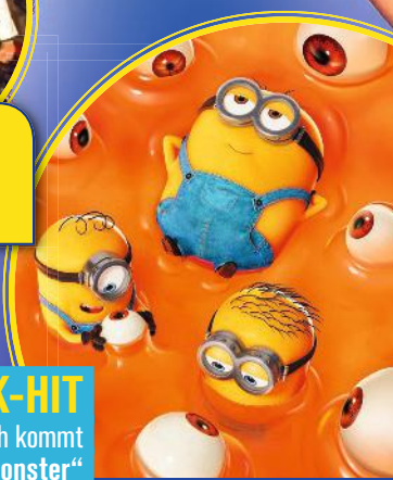
TRICK-HIT Endlich kommt „Minions & Monster“