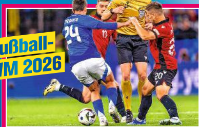
Fußball- WM 2026

Jeden Tag die besten Tipps Netflix, Amazon, Wow, Disney+ & RTL+