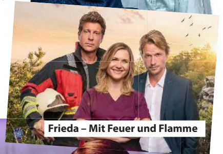
Frieda – Mit Feuer und Flamme