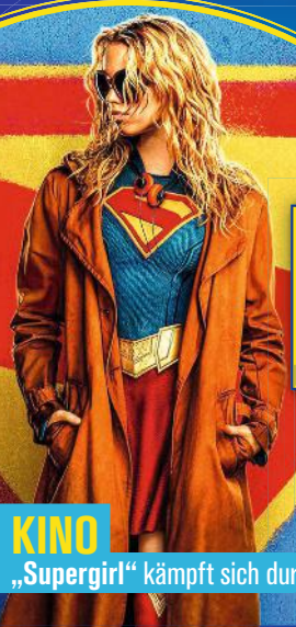
KINO „Supergirl“ kämpft sich durch