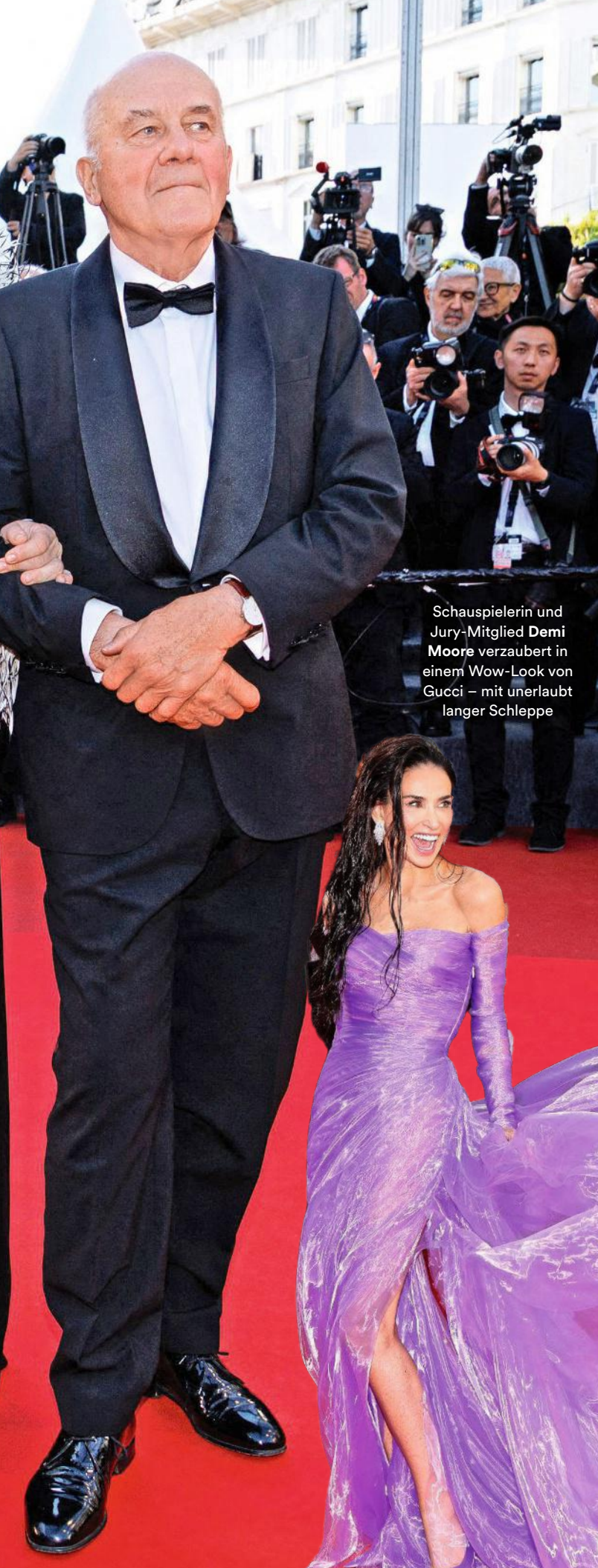
Schauspielerin und Jury-Mitglied Demi Moore verzaubert in einem Wow-Look von Gucci – mit unerlaubt langer Schleppe