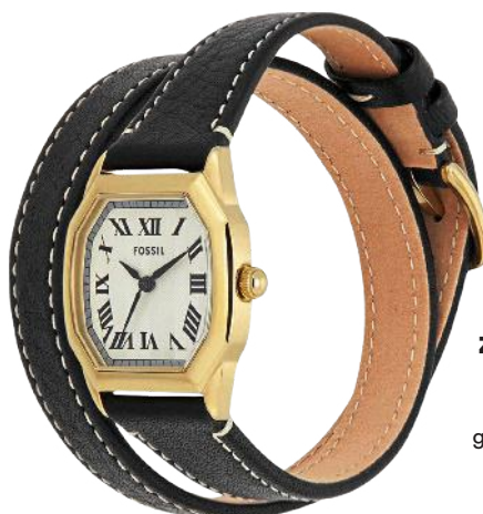
ZEIT FÜR NEUES Uhren mit gewickeltem Armband S. 52