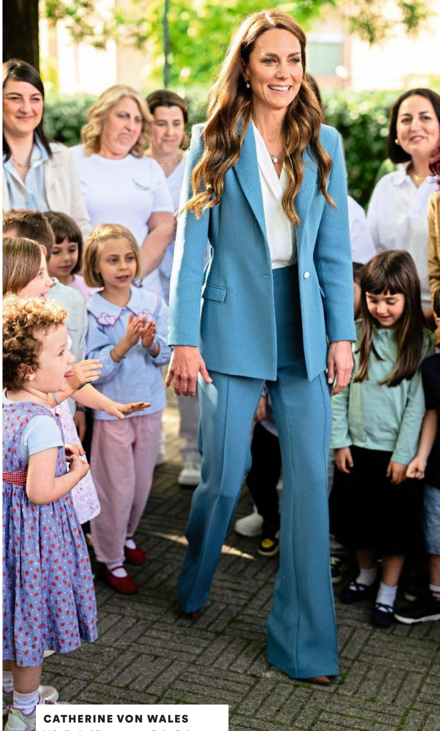
CATHERINE VON WALES Wie ihr bei ihrer ersten Solo-Reise die Herzen der Italiener zufflogen S. 44