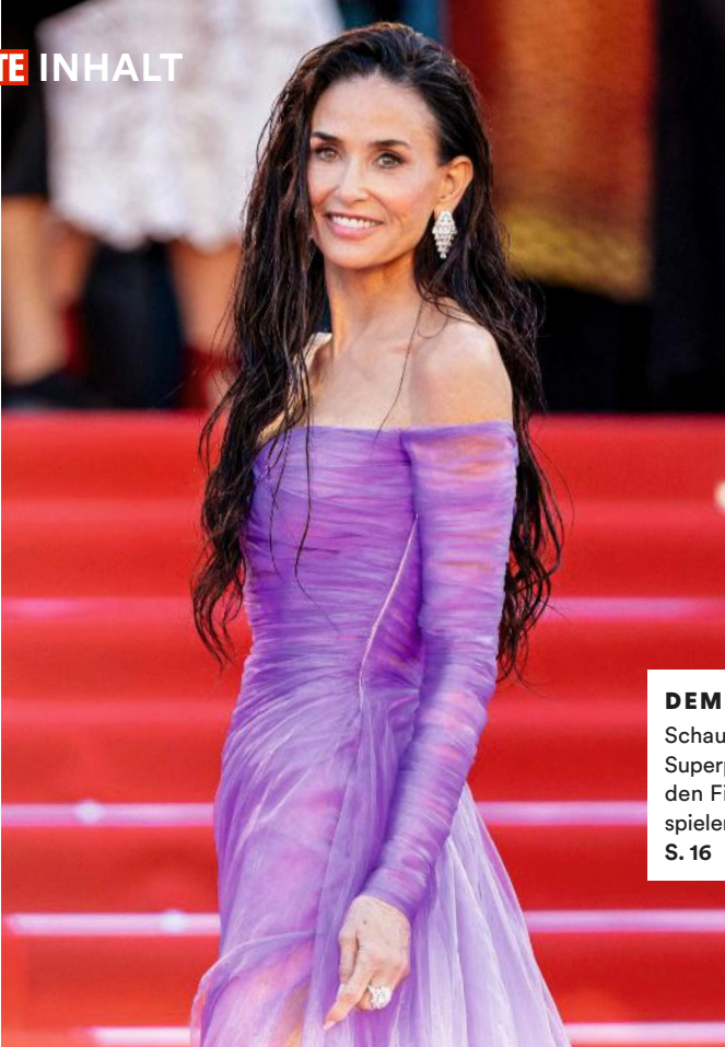
DEMI MOORE Schaulaufen der Superpromis bei den Filmfestspielen in Cannes S. 16