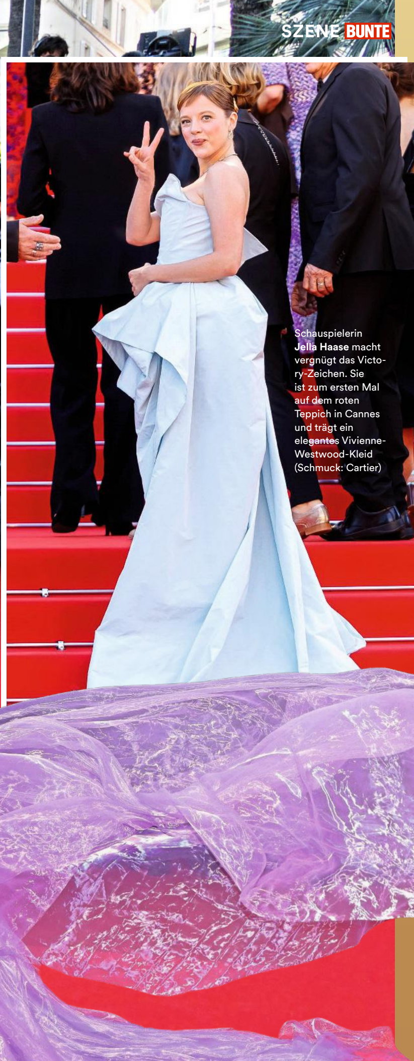
Schauspielerin Jella Haase macht vernügt das Victory-Zeichen. Sie ist zum ersten Mal auf dem roten Teppich in Cannes und trägt ein elegantes Vivienne-Westwood-Kleid (Schmuck: Cartier)