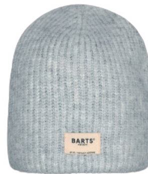
Heather grey (410166)