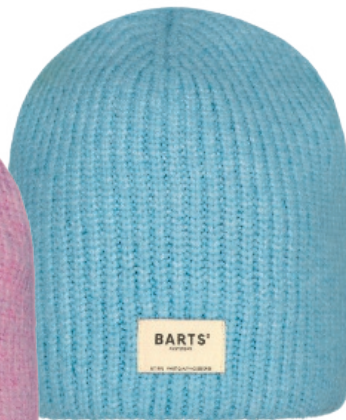
Light blue (410165)

BEANIE „DARTY“ VON BARTS® AMSTERDAM Beanies mit coolen Label-Patch – 5 Farben zur Auswahl, one size, Materialmix aus Wolle/Acryl/Elasthan, maschinenwaschbar