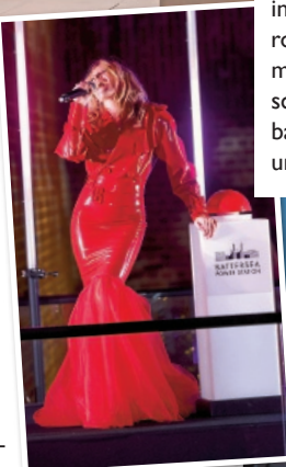
Kylie strahlte in blauem und rotem Lack mit gigantischen Christbaumkugeln um die Wette

Es weihnachtet sehr – und so ließen es sich Schauspielerinnen Anna Taylor-Joy (29) und Sängerin Kylie Minogue (57) nicht nehmen, die funkelnde Festbeleuchtung in den Metropolen anzuwerfen. Shine on!