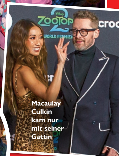
Macaulay Culkin kam nur mit seiner Gattin