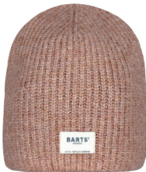
Light brown (410164)