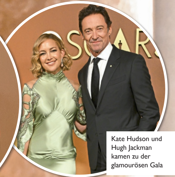
Kate Hudson und Hugh Jackman kamen zu der glamourösen Gala