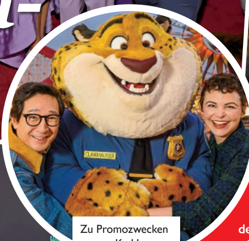
Zu Promozwecken posteten Ke Huy Quan und Ginnifer Goodwin mit dem Maskottchen des Films noch in Disneyland