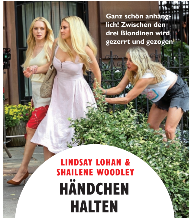
Ganz schön anhänglich! Zwischen den drei Blondinen wird gezerrt und gezogen