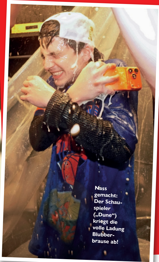
Nass gemacht: Der Schauspieler („Dune“) kriegt die volle Ladung Blubberbrause ab!