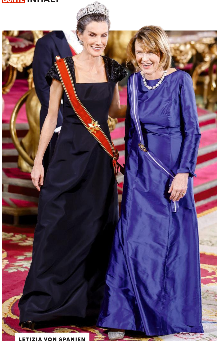
LETIZIA VON SPANIEN

Die Königin empfing beim Staatsbesuch unsere First Lady Elke Bundenbender (r.) wie eine sehr gute Freundin S. 20