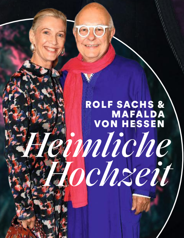
ROLF SACHS & MAFALDA VON HESSEN Heimliche Hochzeit

BORIS BECKER DIE ERSTEN FOTOS VON SEINEM BABY