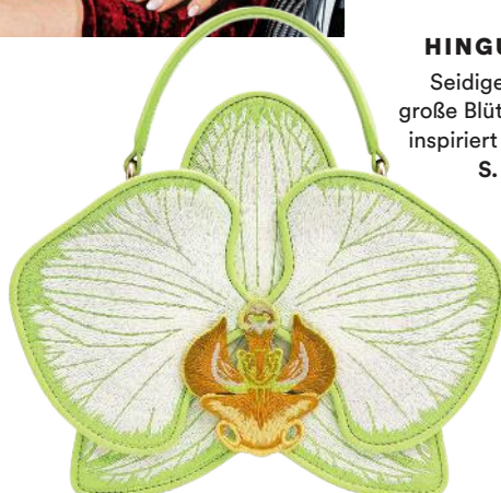
HINGUCKER Seidige Stoffe, große Blüten – Asien inspiriert die Mode S. 48